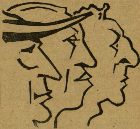
Mellis István linoleum metszete