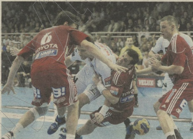
Hatalmas csatában győzött a Pick a Montpellier ellen.

Minden szegedi szurkoló vágya és álma valósult meg novemberben. Hosszú, közel 3 és fél éves sikertelenség után ismét nyert a Pick Szeged férfi kézilabdacsapata a nagy rivális, az MKB Veszprém ellen. Totális telt ház és remek hangulat jellemezte a rangadót, amit 24-23-ra megnyert a Pick. Mindenképpen fényes és remek diadal volt ez a magyar bajnoki címvédő ellen. Sajnos ezután a sérülések miatt tartalékos Szeged elvesztette a veretlenségét a Budapest Bank férfi kézilabdiligában, a Tatabánya otthonában nem várt vereséget szenvedett.