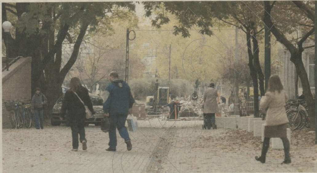
A Semmelweis utca új burkolatot kapott. Az új klinika mellett épül az újabb.

A Szeged Biopolisz Park – egyetemi városrész rehabilitációja projekt 3. eleme a Semmelweis utca és környéke közterületi rehabilitációja. A kivitelezés összköltsége bruttó 324 millió forint, a projekt az Európai Unió 70 százalékos támogatását élvezi. A kivitelező a Biopolisz Park Konzorcium.