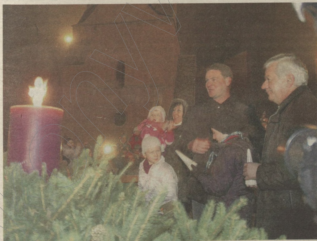
Kiss-Rigó László szeged-csanádi megyés püspök és Botka László, Szeged polgármestere gyújtotta meg múlt vasárnap az első gyertyát a Dóm téri adventi koszorún. Az ország egyik legnagyobb, mintegy 10 méter átmérőjű ünnepi koszorújának gyertyáit karácsonyig minden vasárnap az egyházak és a közélet képviselői közösen gyújtják meg.

Sporttörténelmet írt a Szeged Beton pólócsapata