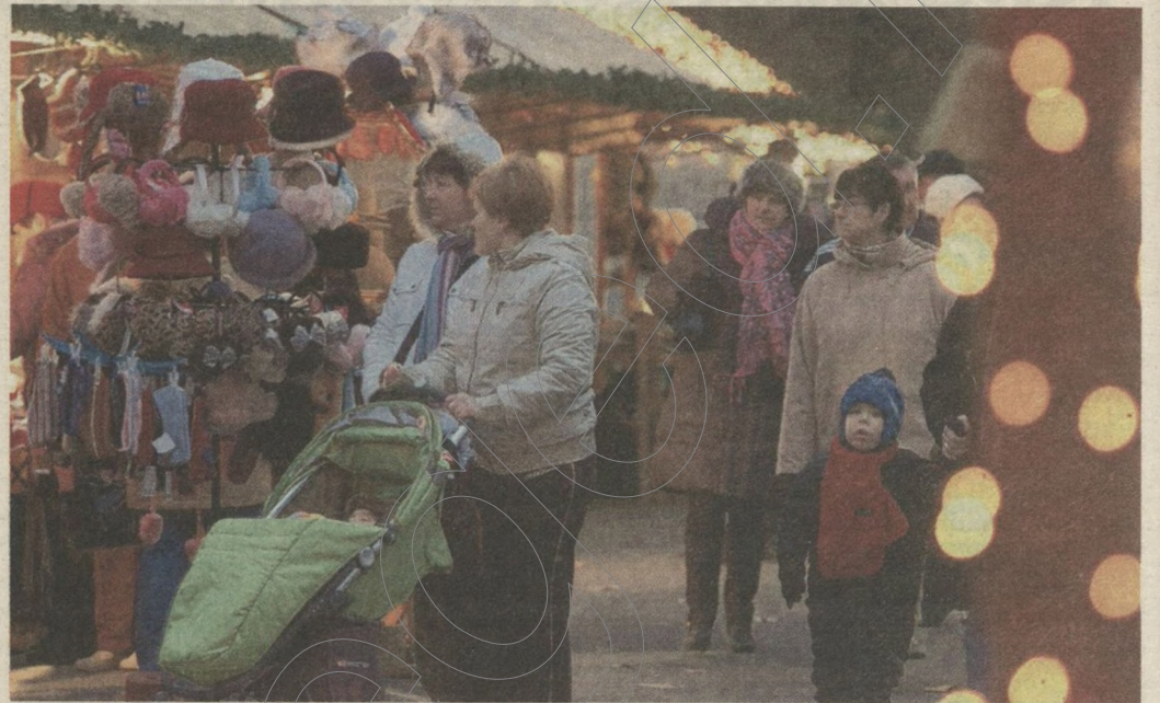
A Széchenyi téri vásárból is beszerezhető a fa alá való ajándék.

A Széchenyi téri faházakban hatvan kereskedő kapott helyet. Kínálatukban minden megtalálható, amit az előző években már megszokhattunk és megszerettünk. Ruhaneműt a szőrmétől a sapka-sál-kesztyű együtteseken át a fehérneműig mindenfélét megtalálni itt. Ezeket nyilván inkább saját maguknak választják az érdeklődők, de ajándéknak való szuvenírekből is találni bőven. Elektromos berendezések a férfiaknak, ékszerek a nőknek, illetve apró műtűrök azoknak, akiket semmi mással nincs ötletünk meglepni. És persze játék minden mennyiségben, amelyek közül a táncoló, zenélő plüssök továbbra is nagy slágernek számítanak – és amelyek nemcsak a gyerekeket képesek hosszú percekig elszórakoztatni. Aki karácsonyi dekorációt keres, annak is elég itt szétnéznie, hiszen a díszektől a gyertyákon át az egyéb kiegészítőig rengeteg mindent kínálnak a kereskedők. Kézműves terméke-