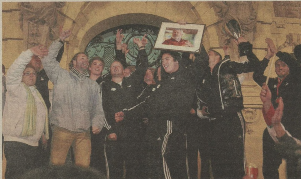
A kupagyőzelem után a csapat a városháza előtt ünnepelt.