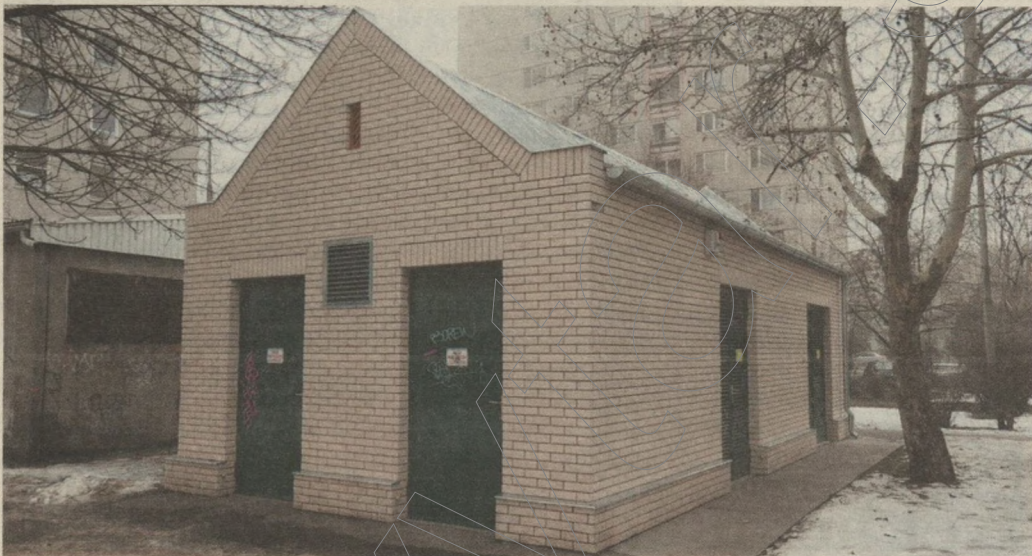
Az SZKT új trafóháza a Rózsa utcában.

A 8-as trolivonal meghosszabbítása és a 10-es trolivonal kiépítése ugyancsak az áramellátó tender részeként valósult meg. A 8-as vonal öt megállóval bővült, ennek köszönhetően Rókustól a klinikáig átszállás nélkül közlekedhetnek az utasok. Az új 10-es trolivonal létrehozásával pedig a tarjániai számára is közvetlenül elérhetőek lesznek a Klinikák végállomástól a Tisza-parti egészségügyi és oktatási intézmények.