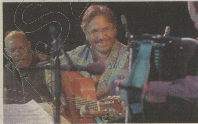
Al Di Meola december 18-án ad koncertet a nagyszínházban.