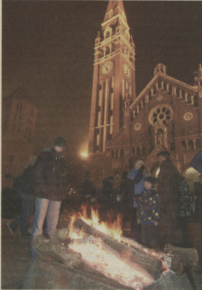
A Dóm téri hangulatot tűz is melegíti.

Forralt bor, kürtőskalács, sült gesztenye, szalmalabirintus és a hangulatos bódéváros – megnyitott Szeged belvárosában a karácsonyi vásár. Idén is három helyszínen kínálják portékáikat az árusok, de nem csak pénzköltésre van itt lehetőség: szentestéig folyamatos programokkal várják az érdeklődőket.