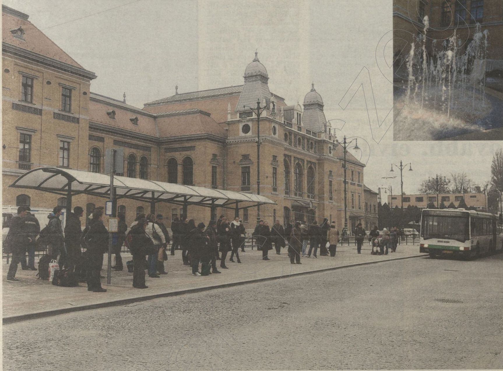
Az Indóház tér szemet gyönyörködtetően fiatalodott meg. Hamarosan pihentetni lehet a villamospótló autóbuszokat.