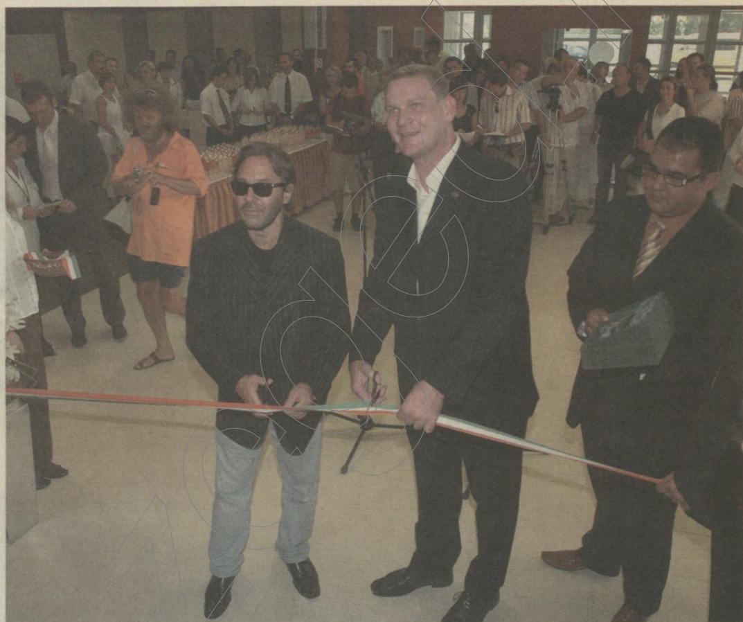
Al Di Meola világhírű gitárművész és Botka László polgármester avatta fel az újjávarázsolt IH Rendezvényközpontot

A színpad nagyobb lett, és körben oldaljárásokkal ellátott függőnyt kapott. A mennyezetre motoros vetítőlámpákat és nagy fényerősségű projektort szereltek. A színpadhoz zongoratóráló kapcsolódik,