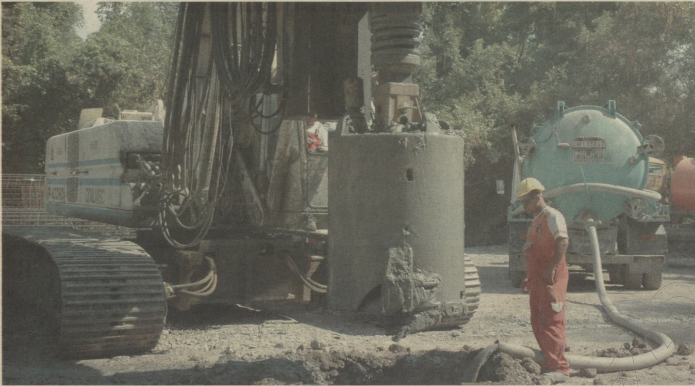
Tápé határában már hetek óta dolgozik a cölöpverő: 35 méteres mélységbe fúrnak le

Augusztus végén megkezdődött az M43-as autópálya építése: a sztrádaépítők egyszerre dolgoznak Tápé fölött az épülő Tisza-híd cölöpözésénél és a régi 5-ös út kettős körforgalma mellett, az M43-as már meglévő, 3 kilométeres szakaszánál.