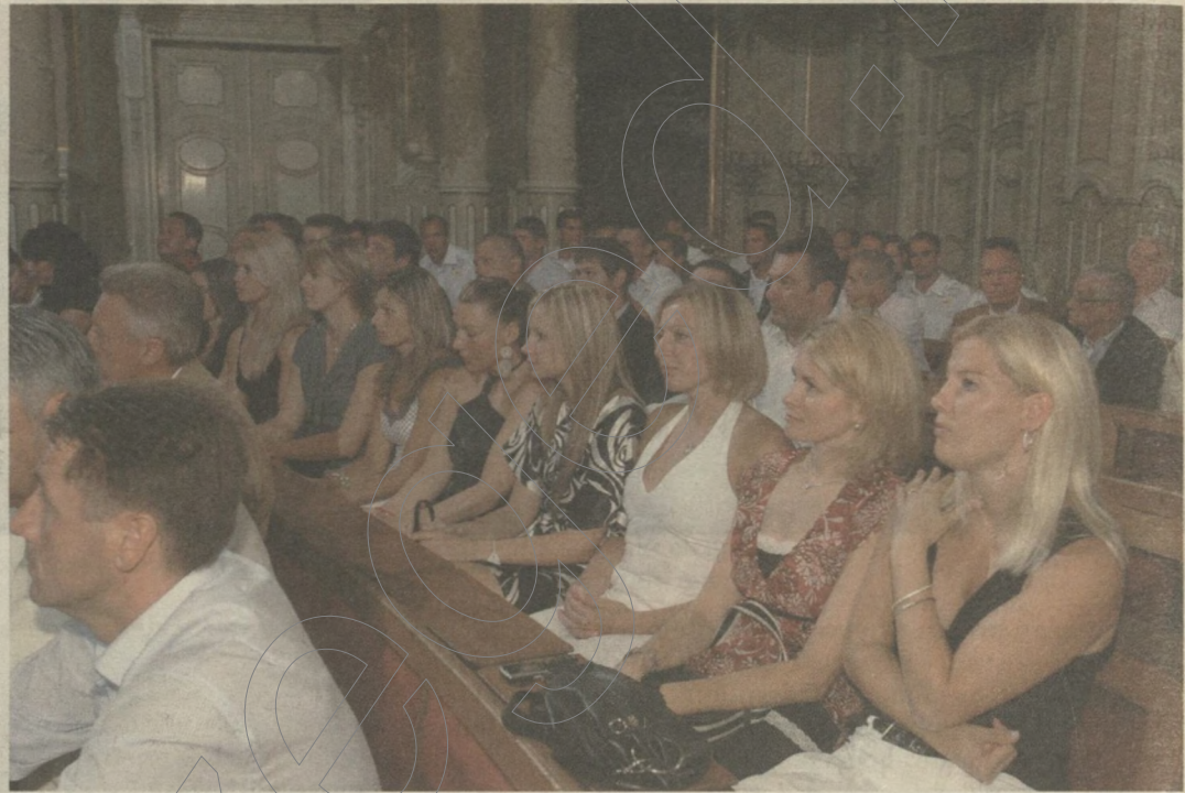
A Pick kézisei és a Szeviép kosarasai a városháza dísztermében

Az elkövetkező három évre a Pick Szeged, a Démász-Szegedi VE, a Szeged Beton VE, a Szeviép-Szeged és a GabonaTranz-Szegedi TE kapott kiemelt támogatást az önkormányzattól.