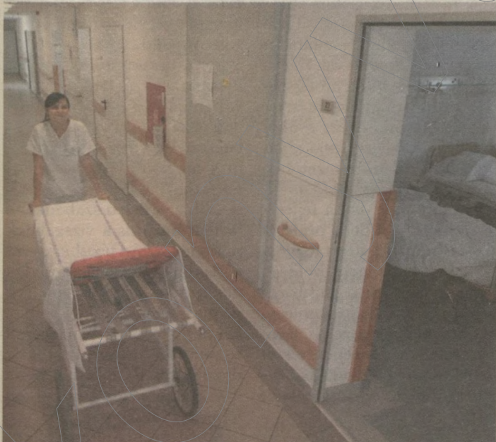
A városi kórház felújított urológiai osztálya. A kórház rekonstrukciójára 2,5 milliárdot fordított az önkormányzat

Közösen értékelték nemrégiben a város és az egyetem vezetése a szegedi egészségügyi integráció tavaly október óta tartó folyamatát, amiről Botka László polgármester úgy nyilatkozott, hogy egy év alatt annyi fejlődés történt a szegedi egészségügyben, mint máskor tíz év alatt.