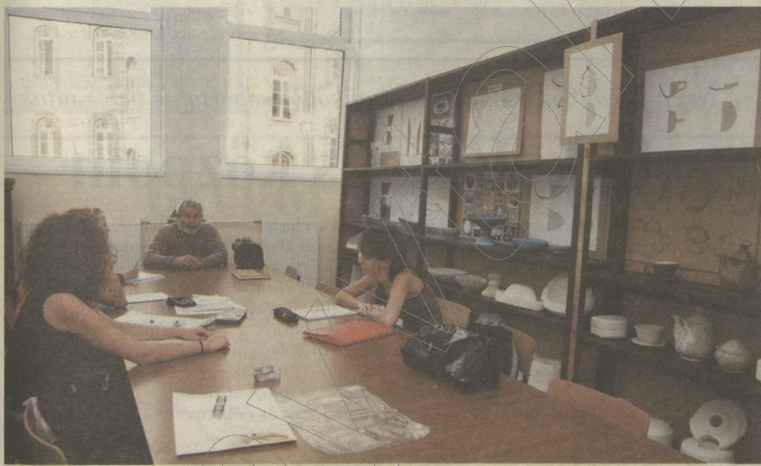
A panorámaablak, amit tanár és diák egyaránt dicsért

Tiszta, levegős, világos – ezeket a jelzőket használták legtöbbször a Tömörkény István Gimnázium és Művészeti Szakközépiskola tanárai és diákjai a nemrégiben hivatalosan is átadott új épületszárnyal kapcsolatban. A patinás szegedi középiskola 600 millió forintból újult meg.