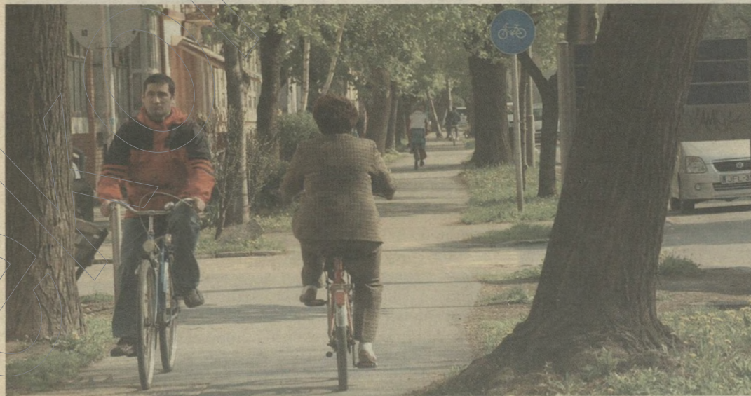
Október közepére már 60 kilométer kerékpárút lesz Szegeden

párral áthaladókat. Újszegeden összekötik a ligetet a Fő fasoron keresztül a marostói bicikliúttal. A dorozsmai kerékpárútból elágazást nyitnak a 48-as utcán a Széksősi úttól a Vásártér utcáig, valamint megépül a Pihenő utca folytatása is a baktói kiskertek felé. Biciklisávot alakítanak ki a Kossuth Lajos sugárúton a Pacsirta utcától a Bocskai utcáig: itt a járdára húznak kerékpársávot, mert biztonságtechnikai okból és helyszűke miatt csak itt fér el. Kerékpárúttal kötik össze a Mars teret a Széchenyi térrel: új út készül a Mikszáth Kálmán-Károlyi utcától a Vár utcáig. A Csongrádi sugárúton pedig kiszélesítik az útestet a meglévő kerékpársávok mellett a Rózsa utca és nagykörút között. Ezután visszaállhat a kétszer kétsávos autóközlekedés is. A leghosszabb új bicikliút a Csillag tértől a Keresztöltés utca-Etelka sor-Felső Tisza-parton át a tápéi Budai Nagy Antal utcáig ér majd.