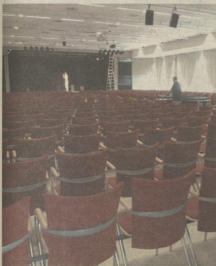
A nagyteremben 600 nézőt tudnak leültetni