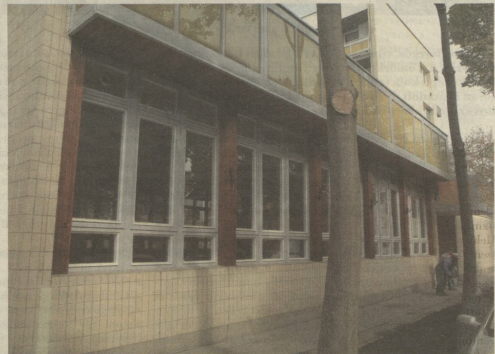
Színes programok várják az időseket a felújított centrumban