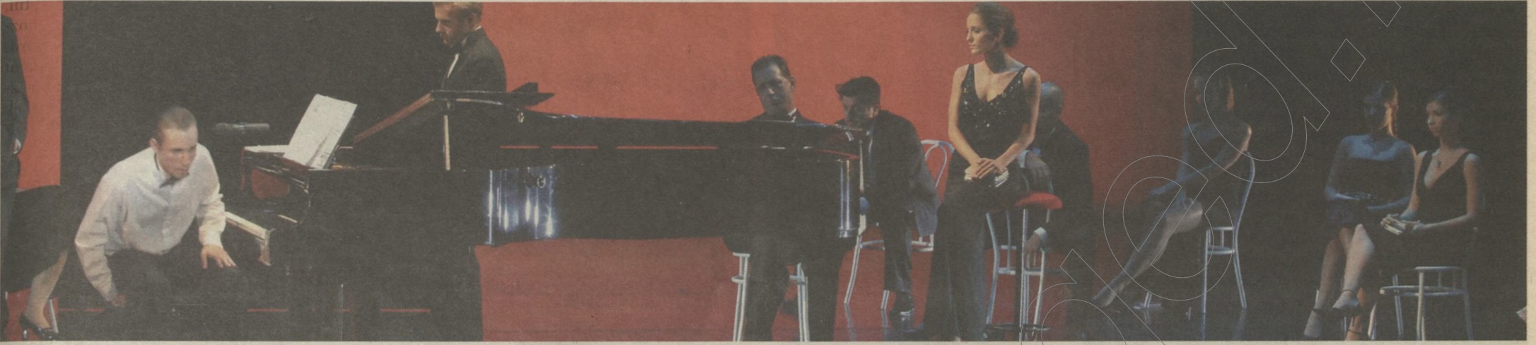
Az évadnyitó gálán egy-egy számmal mutatkoztak be a szegedi színházhoz szerződött fiatalok

Tizennégy premiert tervez a szeptember 26-án induló 2008/2009-es évadra a Szegedi Nemzeti Színház új vezérkara: felfrissített, megfiatalított társulattal, új rendezőkkel hét bemutatót játszanak a nagyszínházban, hetet a kisszínházban. Világraszóló attrakciónak ígérkezik az operafesztivál is.