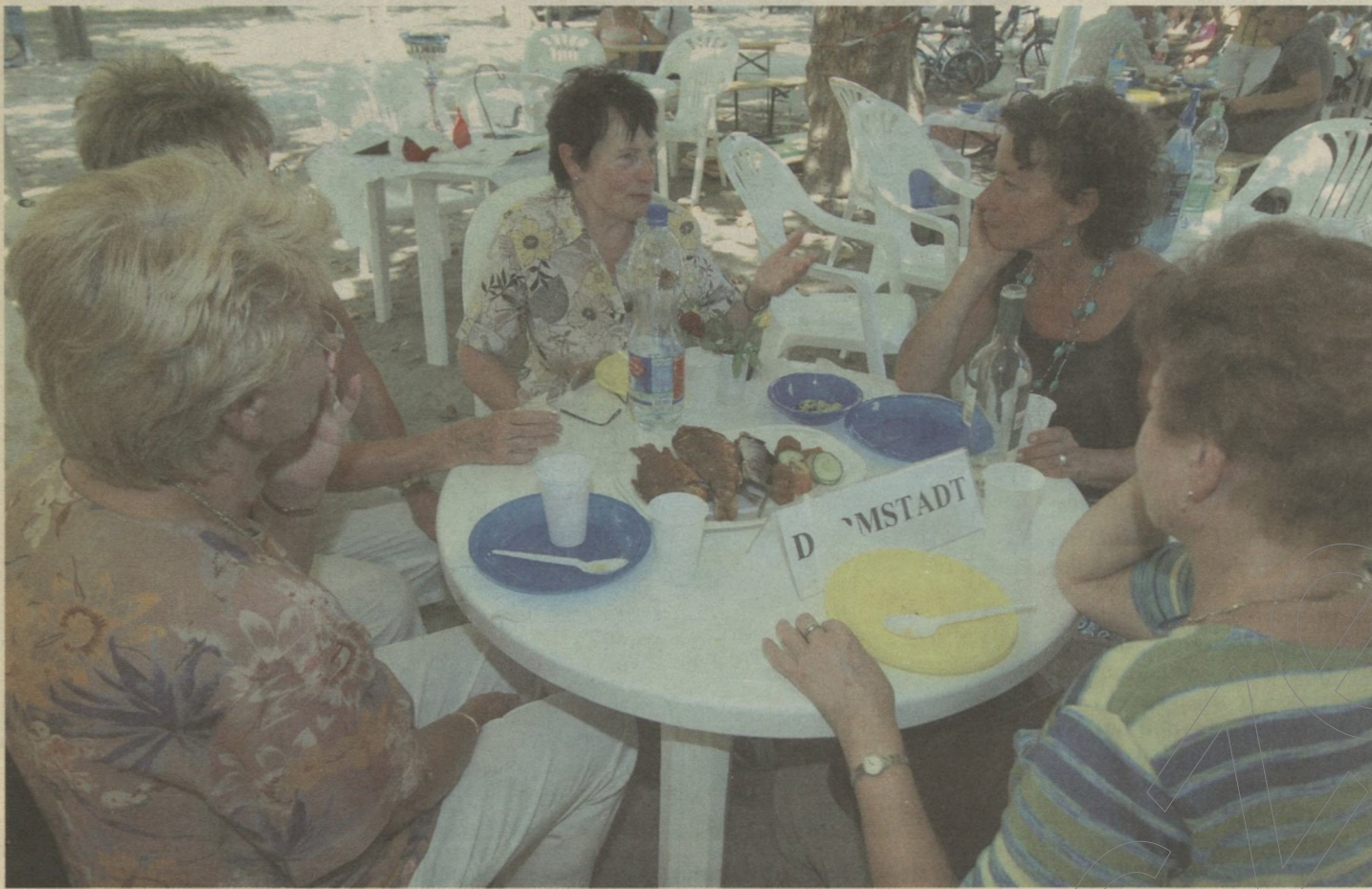
Darmstadti nyugdíjasok a halfesztiválon

Közel negyedmillióan szórakoztak szeptember első hétvégéjén a Tisza két partján Szegeden, a XII. nemzetközi tiszai halfesztiválon. A Partfürdőn a szegedi időügyi tanács vendége volt 15 német nyugdíjas, akik Szeged testvérvárosából, Darmstadtból érkeztek a rendezvényre, ahol ellesték a halászlékészítés csínját-bínját. A németeknek nagyon ízlett a hallé, megígérték, hírét viszik a szegedi finomságnak.