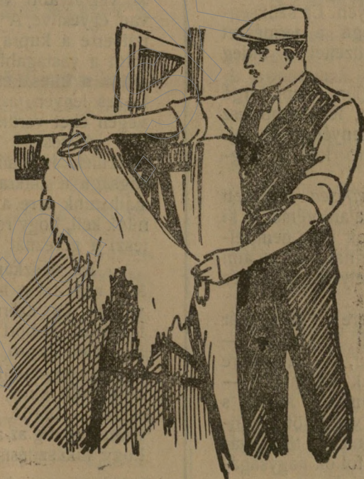
áztatott nyulbőr hornyolása.

a husos részeket, bőrcsapatokat leszedjük a bőrről. A hornyolókés lehet falécdarabba vert kaszadaráb, melynek éle kifialaku, vagyis a közepén kidomboruló. A lehusolt bőrt, alulfordítva szőrét, asztalra terítjük, szétsimitjuk és páclével bőségesen bekenjük.