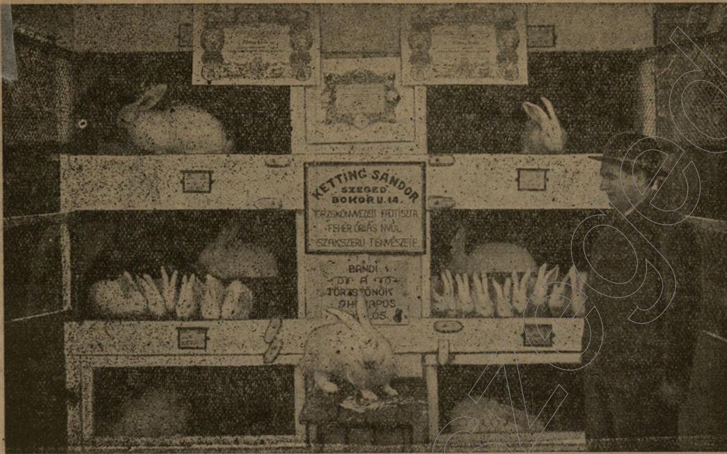
Bandi a törzsfőnök.

Fehéróriás bakk. Mérete 74x19x8. Selymes lõmõtt bunda. Kitünõ utódokat nevel. Nagydíjat, több I. díjat nyert. Telepem nõstényei a Hangya Belgaóriás házinyultelep fehér óriás bakjától is párosodtak, úgy hogy a különbözõ bakoktól mindig teljesen friss vérü választási ivadékokat tudok adni drb.-ként 5 pengõért.