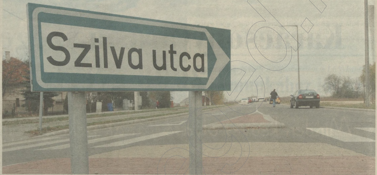
A dorozsmai körforgalomtól indul jövőre a beruházás

A nyugati elkerülő út első szakaszát a Bajai és a Szabad-