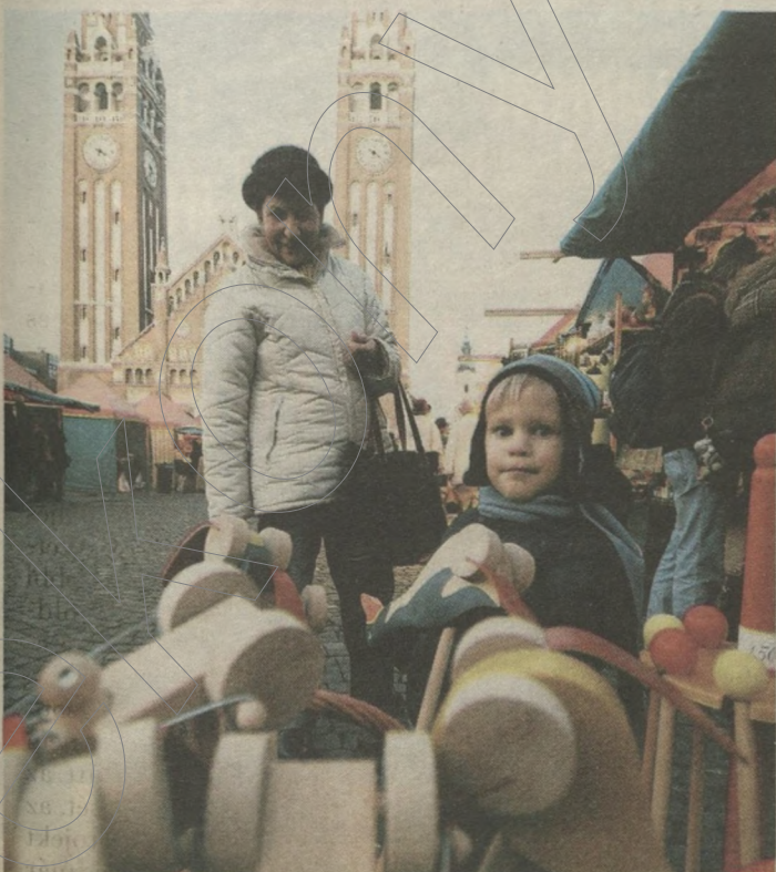
Egy fiatal vásárló a Dóm téren

keresnie. Itt szalonnás sült káposztát ehet stircelt krumplival, amit leöblíthet egy pohár krampampulival. A sült savanyú káposzta és a kolbászsi-