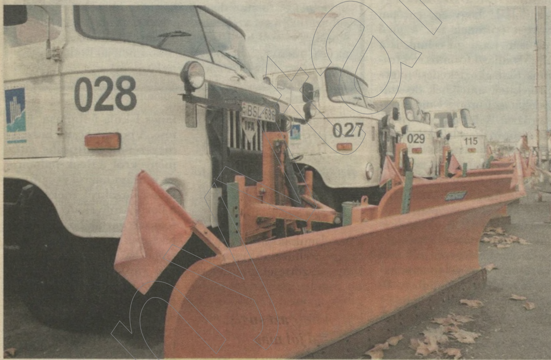
A Városgazda sori telepen már felsorakoztak a hóékék

Kegyes volt eddig az időjárás: sem nagy hideg, sem hóesés nem nehezítette a közlekedést Szegeden. Am a télnek még koránt sincs vége, sok meglepetést tartogathatnak a hideg napok. Szerencsére a város útjaiért felelős Szegedi Környezetgazdálkodási Nonprofit Kft. az idén is időben felkészült a télre: a Városgazda sori központi telepen harminc kisebb-nagyobb gép várja, hogy lehulljon az első hó.