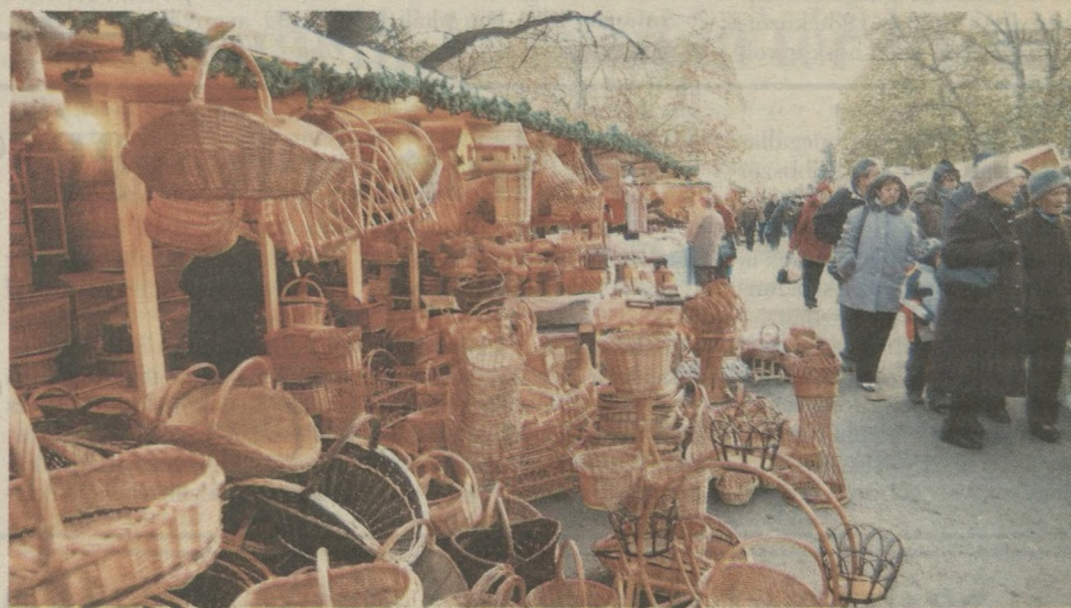
Árubőség a Széchenyi téren

A Dóm tér közepén álló, kétszáz személyes bálaszínházban december 24-éig minden délután óvodások és iskolások előadását, este pedig koncerteket