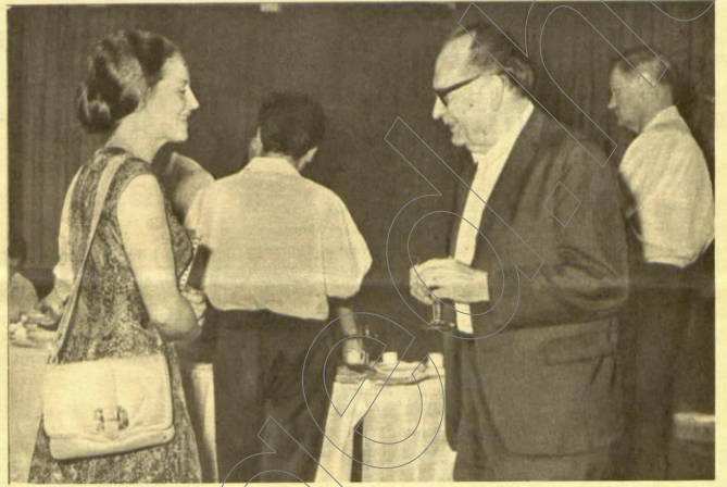
Az Anyanyelvi Konferencia Védnöksége ülésének szünetében Böszörményi István Kodály Zoltánnal beszélget