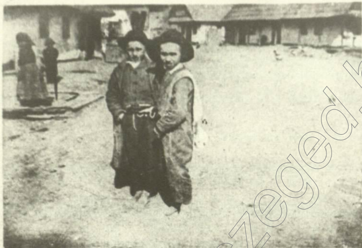
Gyermekek a héber iskolából