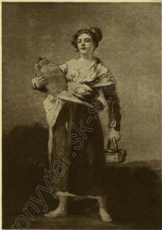
Francisco de Goya 1746-1828