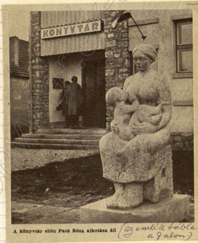
A könyvtár előtt Pató Róza alkotása áll