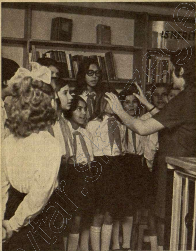
A kisiskolások műsorral szórakoztatják az egybegyűlteket