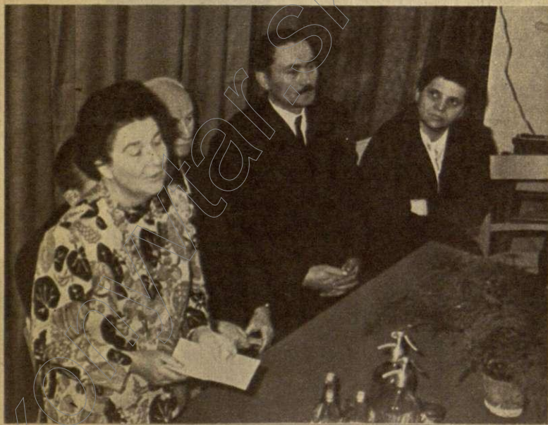
Varga Gáborné, az országgyűlés alelnöke megnyitó beszédét mondja