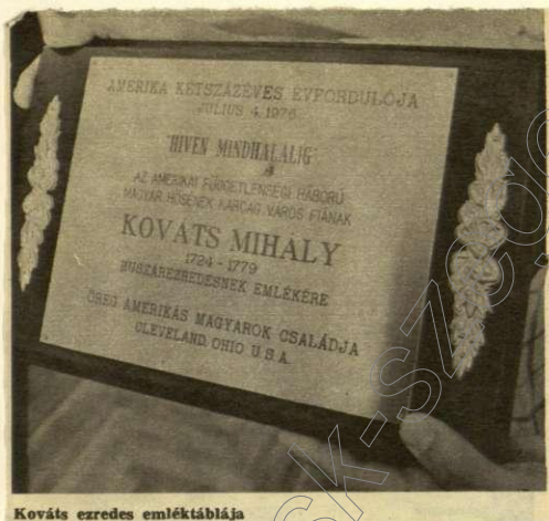
Kováts ezredes emléktáblája