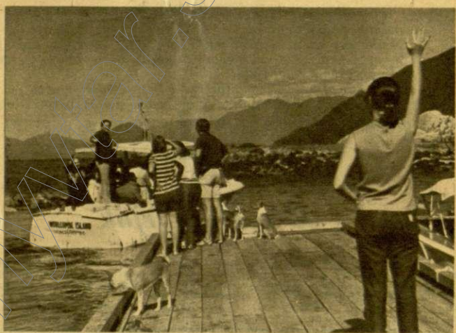
Búcsú a szigettől