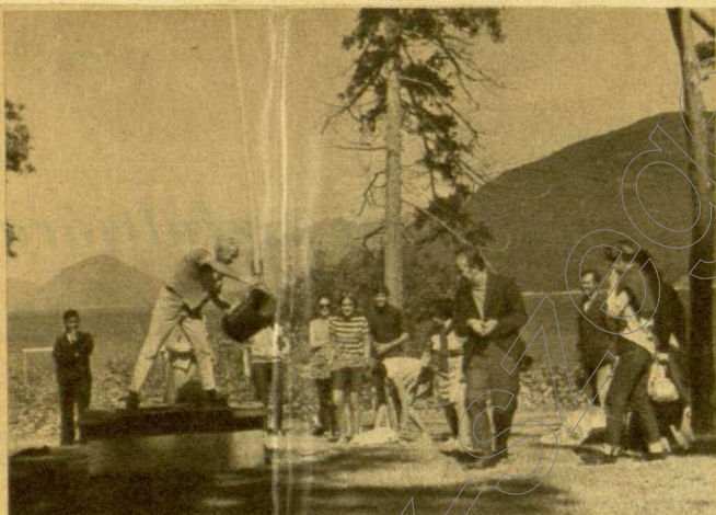
Szerelik a vödört